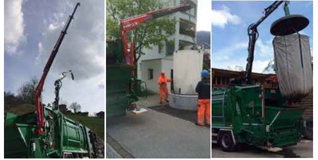
Unser Kran-Demowagen in Aktion!

Konto 30-5198-3 / IBAN: CH49 0900 0000 3000 5198 3 Vermerk: im Gedenken an Käthi Schwendimann