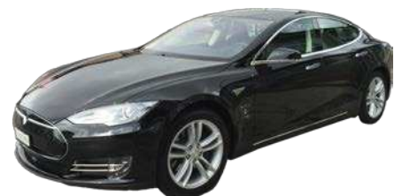
müsste sollte könnte würde hätte machs!

Geschenkidee: Verschenken Sie Freude mit einem Tesla-Gutschein!